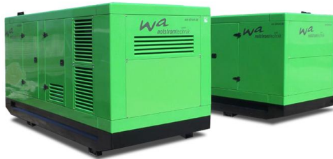
WA-D 500 Ausführung „S“ Schallgedämmtes Aggregat mit manueller Schaltanlage