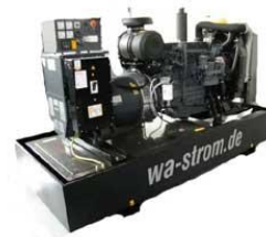
WA – D 250 Ausführung „G“ Grundrahmenaggregat mit manueller Schaltanlage & optionaler Öluffangwanne

Die Kriterien für unsere Stromaggregate in diesen klassischen Einsatzkategorien sind sehr hoch: Hohe spezifische Leistungen bei gleichzeitig langen Wartungsintervallen, Dauerbetriebsfestigkeit auch bei häufigen Lastwechseln sowie eine hohe Startzuverlässigkeit, um nur einige Beispiele zu nennen.