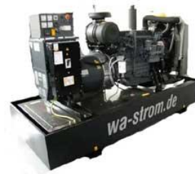
WA-D 500 Ausführung „S“ Schallgedämmtes Aggregat mit manueller Schaltanlage