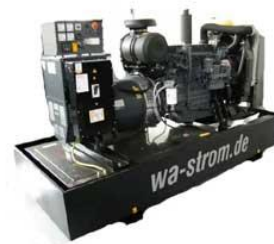
WA-D 500 Ausführung „S“ Schallgedämmtes Aggregat mit manueller Schaltanlage