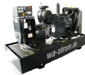
WA-D 500 Ausführung „S“ Schallgedämmtes Aggregat mit manueller Schaltanlage