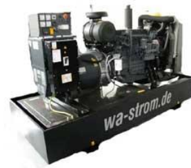
WA-D 500 Ausführung „S“ Schallgedämmtes Aggregat mit manueller Schaltanlage